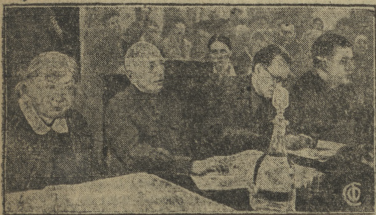
1 апреля в Колонном зале дома советов открылся VIII всесоюзный съезд работников просвещения.