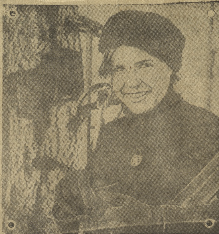
На Свердловскую лыжную станцию приезжают для перенятия опыта физкультурники из разных мест области.

Партийный комитет Динаса должен принять меры, чтобы в дальнейшем такое преподавание истории партии не допускалось. Дьячков.