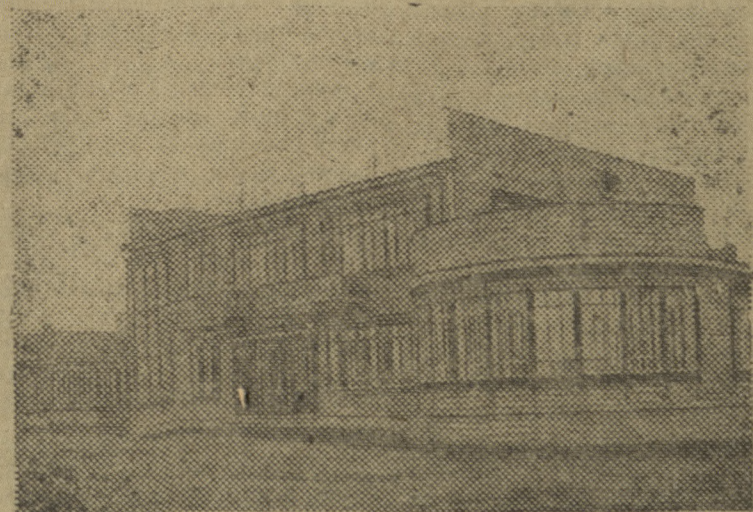
Новый город Режа. На фото дом инженерно-технических работников Средуральмострой

■ Начато строительство дома отдыха на лесном участке каменного рудника № 1. В строительстве уже вложено 100 тыс. руб.