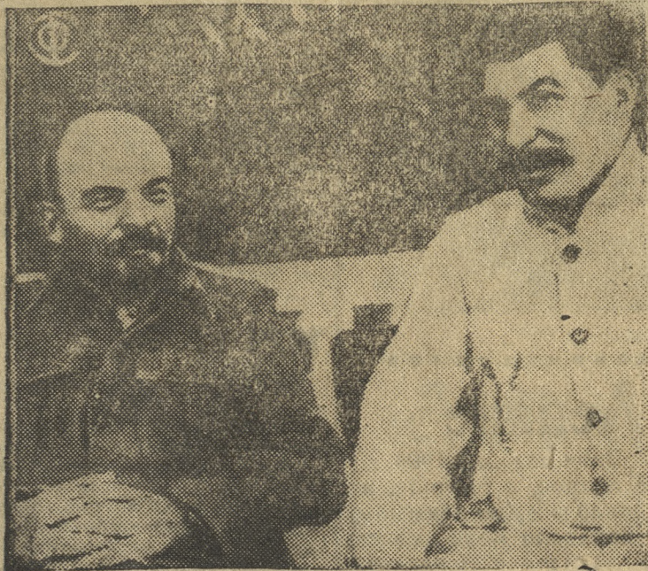
В. И. Ленин и И. В. Сталин в Горках (август 1922 года).

Двенадцатая годовщина со дня смерти Владимира Ильича ЛЕНИНА