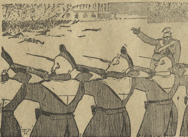
„Встреча“ безоружных рабочих у Зимнего дворца в день „Кровавого воскресенья“ 22 (9) января 1905 г. (См. внизу материал о „9 января“)

Вчера в клубе Металлургов труб завода состоялось траурное заседание пленума горсовета, посвященное 12-й годовщине со дня смерти В. И. Ленина.