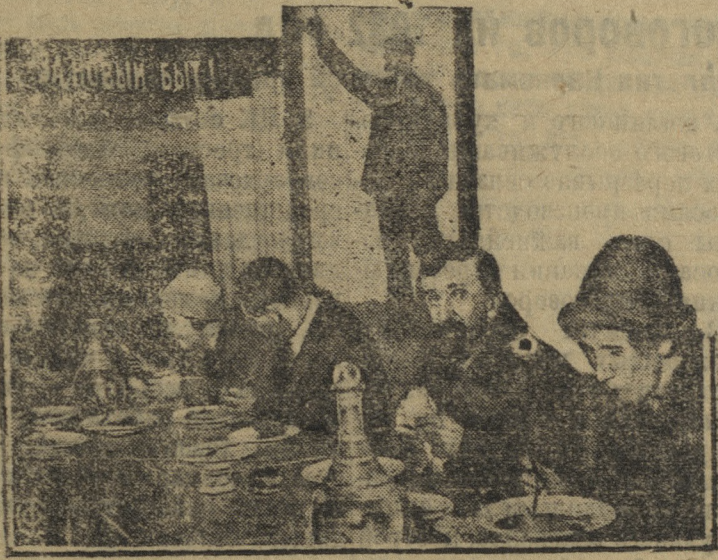
На снимке: За обедом в самодеятельной столовой.