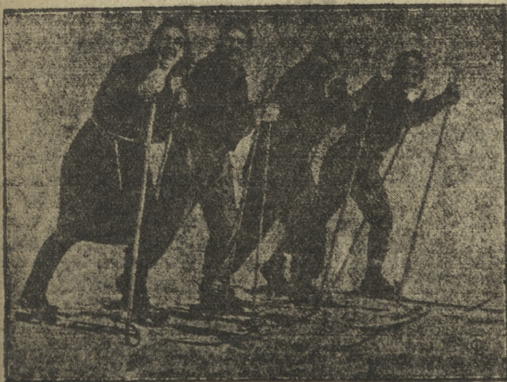
На СТЗ широко развернута физкультурная работа. В выходной день снежные равнины бороздятся рабочими лыжниками.