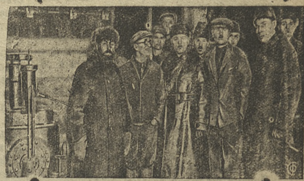
Тов. ВОРОШИЛОВ на пуске десны на заводе св его имени

БЕРЛИН. В Нейкирхене Саарская область, на металлургическом заводе произошла взрыв газометра. Убит при взрыве около 300 человек, ранено свыше тысячи, причем около 300 из них смертельно. Работы по извлечению трупов производятся в чрезвычайно медленном темпе, горючий бензин и газы в облаке ядовитого дыма. Слышны стоны домов, преграды в груду кирпичей. Серваны к, нши с 300 домов.