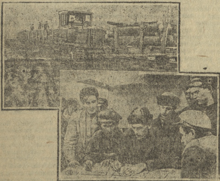
На снимке: Внизу—заключение соглашения между колхозниками ст. Ханской и ст. Дагестанской, работающими на лесозаготовках. Вверху—первая в СССР транспортная узкоколейная жел. дорога для транспортирования леса, построенная в Майкопском лесопромысле.

Майкопский район должен заготовить 273 тысячи кубометров леса, часть которого высококачественный дуб, бук и т. п. идет на экспорт.