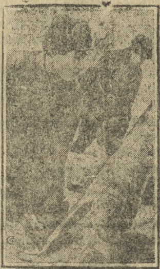
Ударники Трубстроя за рубкой леса для строительства Ново-Трубного завода