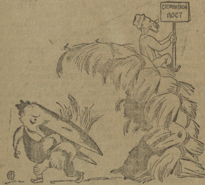
Кулацкий ВОРОН и колхозная ворона

Охрана урожая в ряде районов поставлена из рук-вом плохо. Кулаки и подкулачники, мешочники срезают колоски, расхищают хлеб снопами из копен.