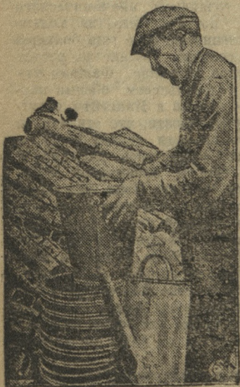
Сортировка предметов широкого потребления, изготовленных из отходов (Вологда, ремонтно-вагон. завод)

Вызываются председатели ФЭМК, завбытсекторами Ревды, Хромпика, Динаса, Билимбая, Трубзавода, Трубостроя, Средуралмедьстрой, а также члены и кандидаты президиума райстрахкасы и ревкомиссии. РАЙСТРАХНАССА.