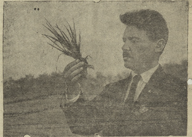
На снимке: Тов. Н. В. Цицин осматривает отрастание многолетней пшеницы после первой уборки урожая на участке селекционной станции в Немчиновке (под Москвой).

Многолетняя пшеница — творение рук советских ученых. Над выведением ее работает доктор сельскохозяйственных наук, депутат Верховного Совета СССР, орденосец Н. В. Цицин.