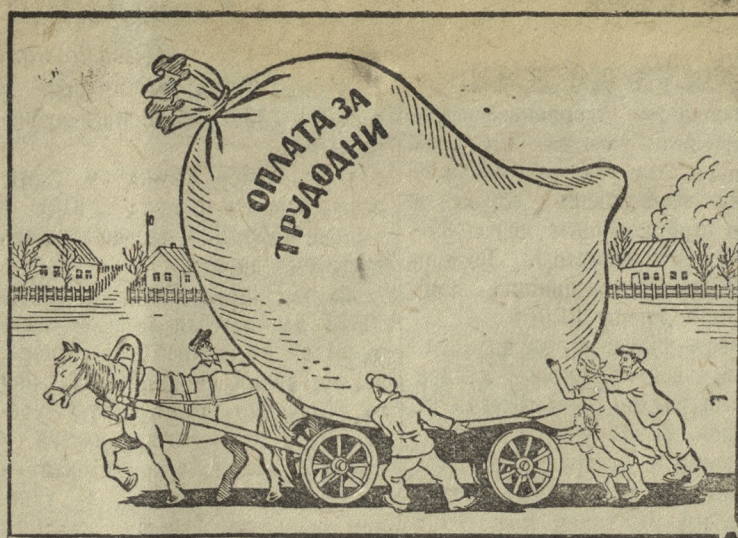
Некоторые «трудности», которые ежегодно переживают семьи колхозников. Рис. В. Лисевича и Сазанова (Прескляше)

Недавние «инциденты» в Северном море являются, повидимому, лишь началом целой серии пиратских актов, организуемых Германией.