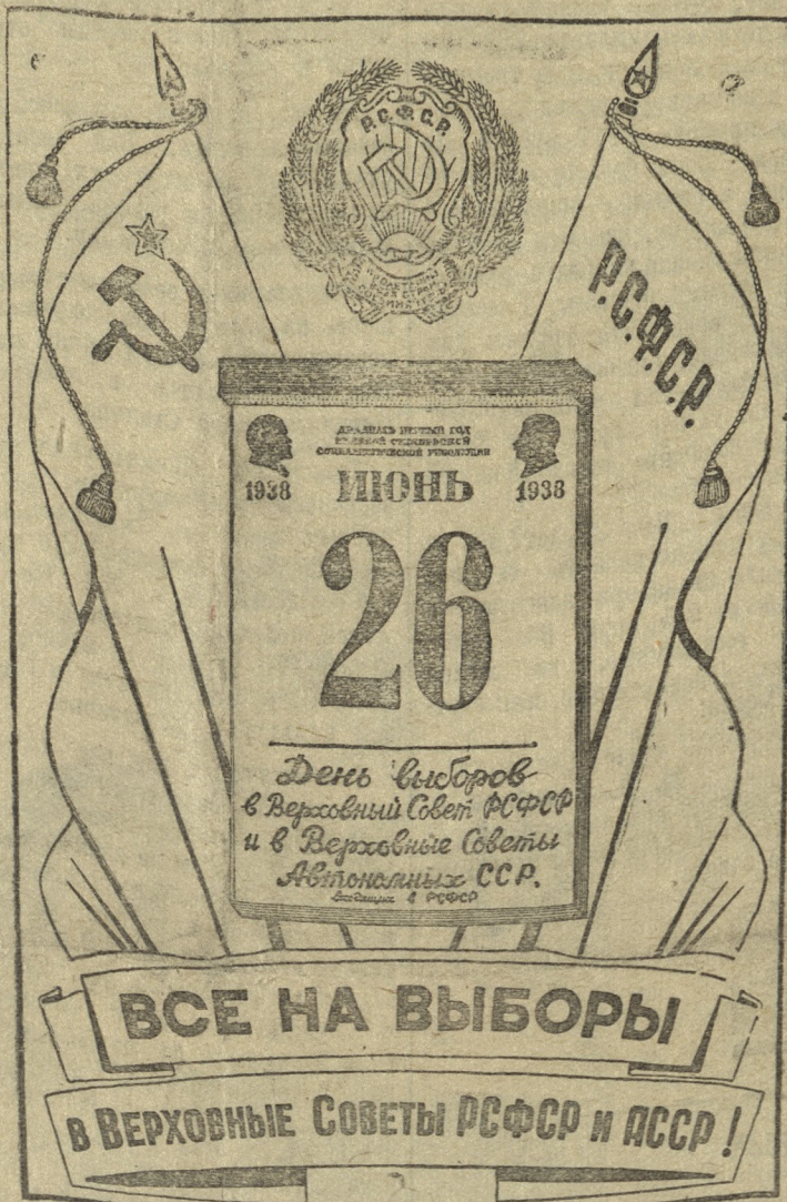
Рис. „Прессклише“ с плаката Изюгина.