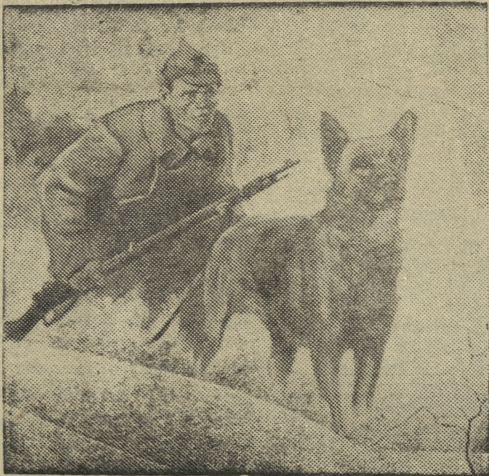
На снимке: „В секрете“ — картина художника А. К. Жаба.