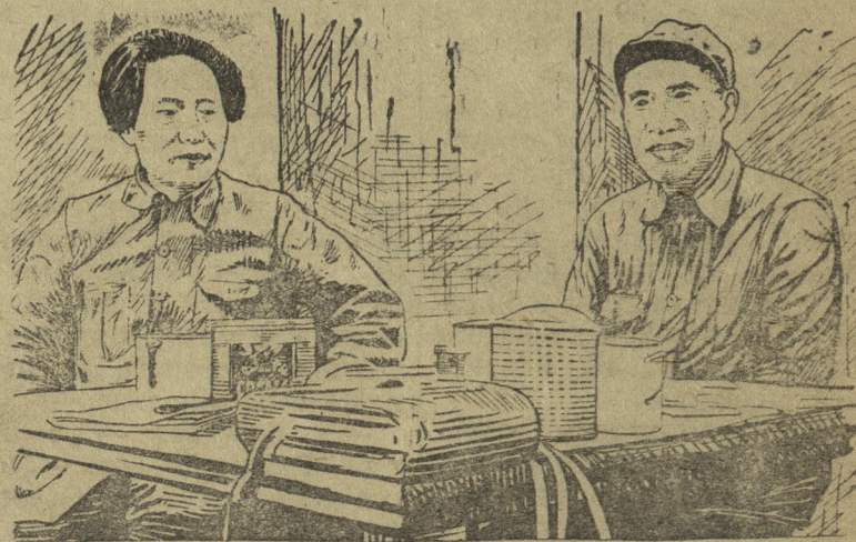
Руководители 8-й национально-революционной армии Китая Мао Цзе-дун (слева) и Чу Дэ (справа) в штабе армии.