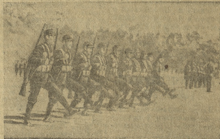
Взвод китайских новобранцев, проходящих строевую подготовку.

Пленум на основе выступлений вынес решение. Уточнены сроки выборов во всех парторганизациях. Выделенные работники райкома партии в помощь парторганизациям в подготовке отчетно-выборных собраний приступают к работе.