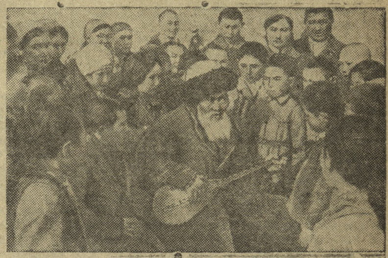
Народный певец Казахстана Джамбул в кругу юных слушателей-школьников колхоза „Ернар“ Кастекского района Алма-Атинской области.

К 75-й годовщине литературной деятельности выдающегося акына, народного певца Казахстана, орденосца Джамбула.