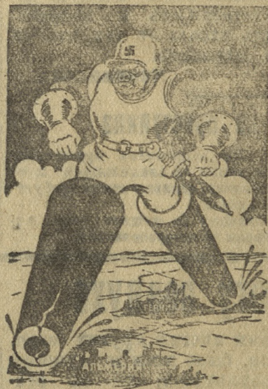
„КРОВАВЫЕ „ШАГИ“ ФАШИЗМА“

По сообщению венского корреспондента венгерской газеты „Пестер ллойд“, до 70 процентов всех австрийских учителей подверглось фашистской „чистке“.