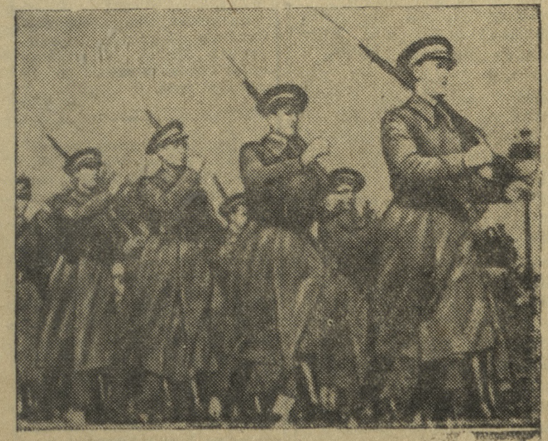
Части республиканской армии во время парада

По сведениям китайского командования, за время военных действий в Китае японцы потеряли 280 тысяч человек убитыми и ранеными. Только в феврале японская армия, оперирующая на центральном фронте, потеряла 5.400 убитыми и 12.700 ранеными. Убито и ранено 400 офицеров.