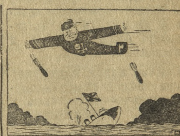
Прогоняют по займу

„Я убежден, — заявляет корреспондент, — что война будет продолжаться даже в том случае, если республиканская Испания будет разделена на две части, а города, лежащие на побережье Средиземного моря, будут подвергнуты воздушным бомбардировкам. Удержание города Лериды после того, как большинство военных наблюдателей считало его потерянным, является блестящим достижением республиканских войск, если учесть весьма неблагоприятные естественные условия обороны“.