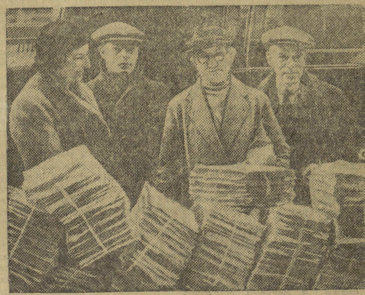
Трудящиеся Англии представили в Палату общин петицию за 700.000 подписей с протестом против дороговизны товаров и низкой заработной платы.

Представители трудящихся, доставившие кипы петиции в Палату.