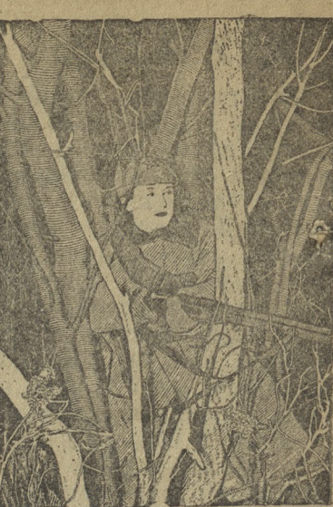
На страже дальневосточных границ. НА СНИМКЕ: Боец Н-ского пограничного отряда Т. М. Посохов в дозоре. Рис. с фото Л. Великжанова (Союзфото).