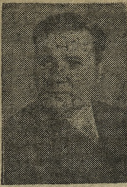
Народный Комиссар торговли М. П. Смирнов.