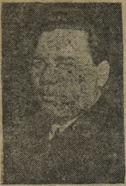
Народный Комиссар военно-морского флота П. А. Смирнов.