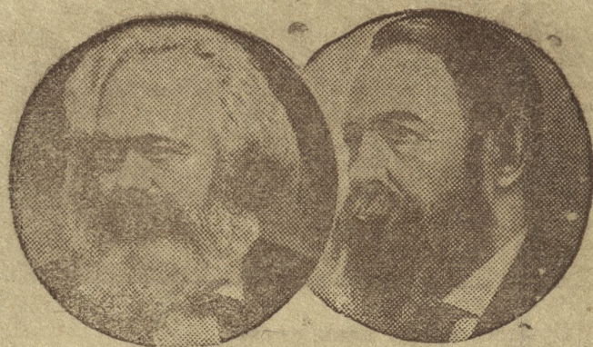
Карл Маркс и Фридрих Энгельс.

„Эта небольшая книжечка стоит целых томов“ — так писал Владимир Ильич Ленин о „Манифесте“. Маркс и Энгельс дали в этой книжке блестящий анализ