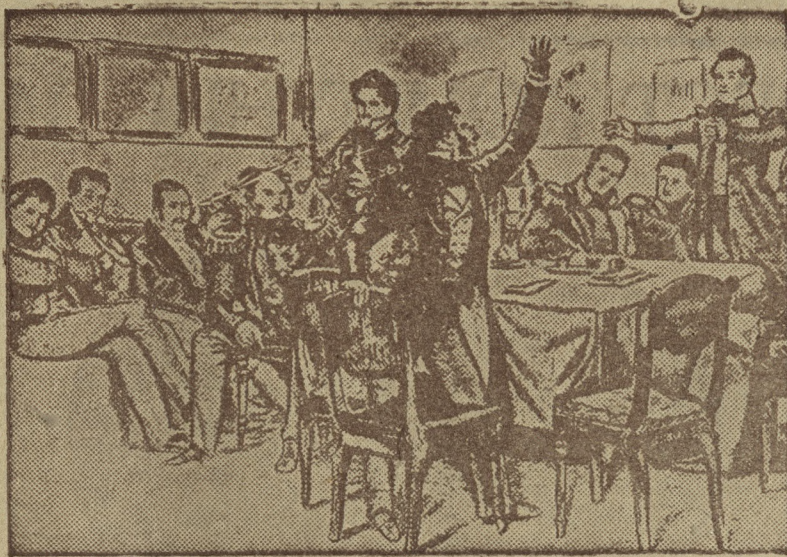
Пушкин среди декабристов

В 1827 году начальник главного штаба военных поселений рапортовал своему начальству: „Ваше сиятельство от 23 го минувшего июля предписать мне изволили: отобрать показания от штаб-капитана Ландсберга и прапорщика Бабятинского, имеют ли они вольнодумственные стихи, от кого оные получили, на какой конец, кому показывали или давали читать, где оные хранятся, чьею сочинения, и какого