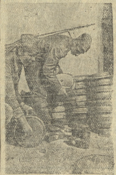
Минеры проверяют взрыватели немецких мин.