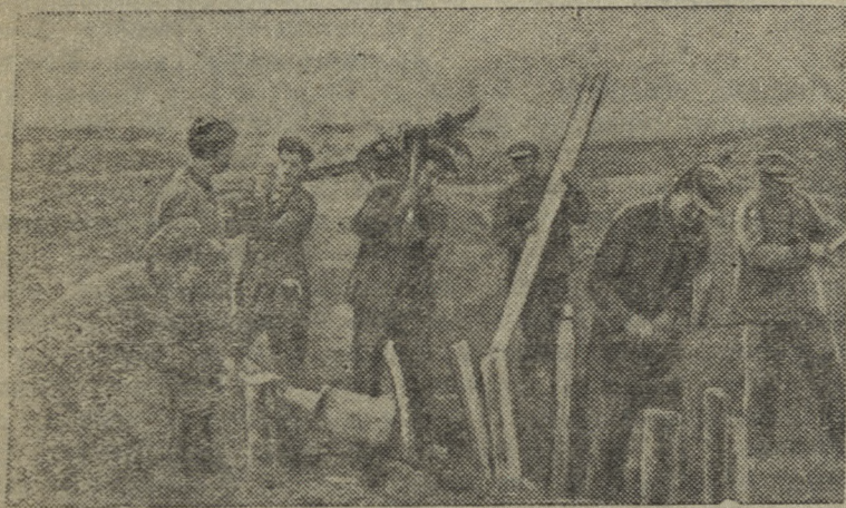
Колхозники строят противотанковые препятствия.

Население прифронтовой полосы самоотверженно помогает бойцам Красной Армии в борьбе против фашистских захватчиков.