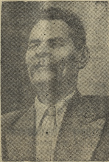
А. М. Горький (1934 г.)