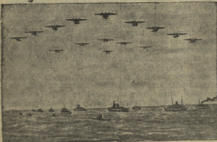
Тактические учения военно-морского и воздушного флотов в Голландской Индии

КОНОВОЗЧИКИ и ЭКСПЕДИТОРЫ для работы на хлебозаводе города и пекарнях Билимбай.