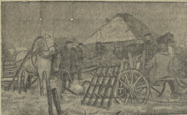
Приемка обобществленного сельхозинвентаря и лошадей правлением колхоза.

В деревне Слобода (Столбцовский район, Барановичская область, БССР) организован новый колхоз „Черемогa“. Колхозники приступили к обобществлению инвентаря, лошадей, кормов и семян, готовятся к весеннему севу.