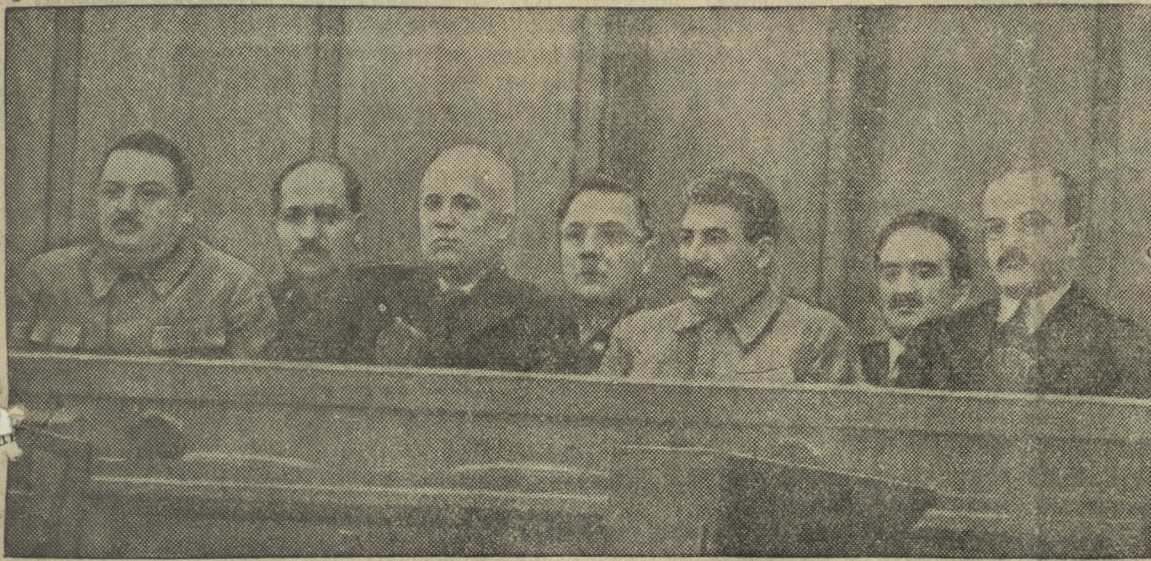
Руководители партии и правительства на совместном заседании Совета Союза и Совета Национальностей. Справа налево: товарищи В. М. Молотов, А. И. Микоян, И. В. Сталин, К. Е. Ворошилов, Н. С. Хрущев, А. М. Каганович и А. А. Жданов.