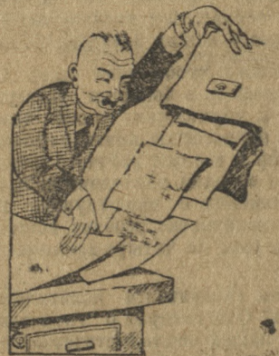
Так смотрят в Ревде на реализацию займа