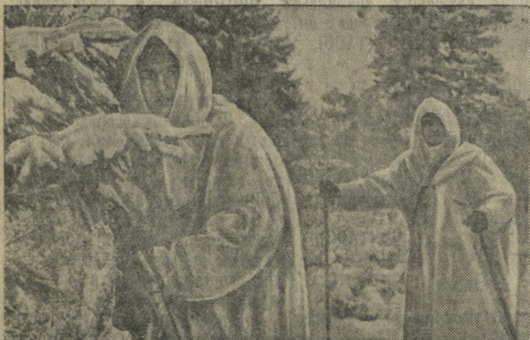
В лыжной разведке. (Н-ская часть Ленинградского военного округа).