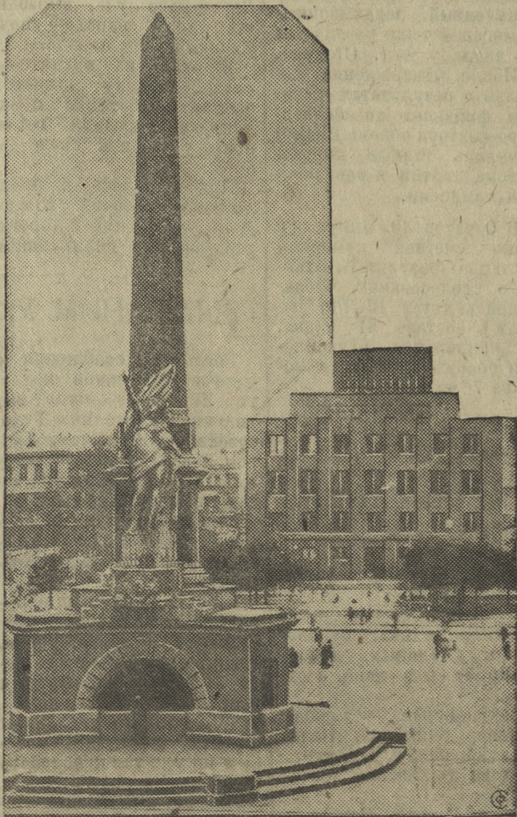
Статуя „Свободы“ и институт Ленина. Москва, Советская площадь

Каждое пренебрежение, проявляемое руководителями предприятий к идеям изобретателей и рационализаторов, на руку злым врагам народа — троцкистско-бухаринско-рыковской сволочи.