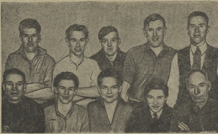
Команда английского транспортного парохода „Линерия“, узнав, что очередной рейс парохода предназначен для перевозки груза на территорию Испании, занятую фашистскими мятежниками, отказалась работать.

НА СНИМКЕ: десять моряков команды английского парохода, отказавшихся работать для фашистских мятежников.