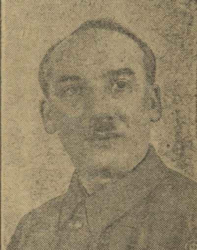
Григорий Григорьевич Ягoda — Народный Комиссар Связи Союза ССР.