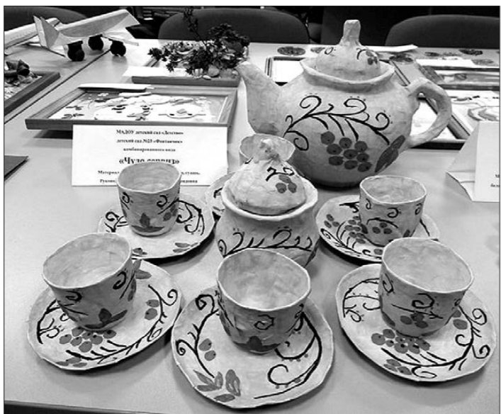
Фрагмент экспозиции на выставке декоративно-прикладного творчества.

Ребята демонстрировали свои достижения в нескольких номинациях: «Декоративно-прикладное творчество», «Художественное слово», «Хореография», «Мастер инструментального творчества», «Литературно-музыкальное творчество, вокал». При подведении итогов учитыва-