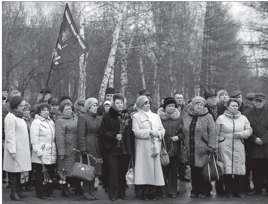
Тагильчане пришли на митинг с цветами.

Проблемы со здоровьем, по словам чернобыльцев, начались почти сразу: стали возникать сильные головные боли, резко упало давление, начали разрушаться зубы. «Мы потеряли не город, а целую жизнь», - замечают они. Многих очевидцев трагедии уже нет в живых. Последствия аварии ликвидировали 474 тагильчанина. В Чернобыль уезжали и добровольцы, командированные организациями и предприятиями города. Все работы в опасной зоне выполнялись тагильской техникой. Она