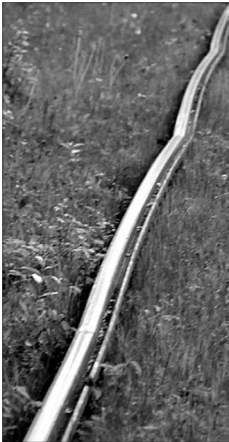
Наш ответ дорогим слабительным лекарствам.