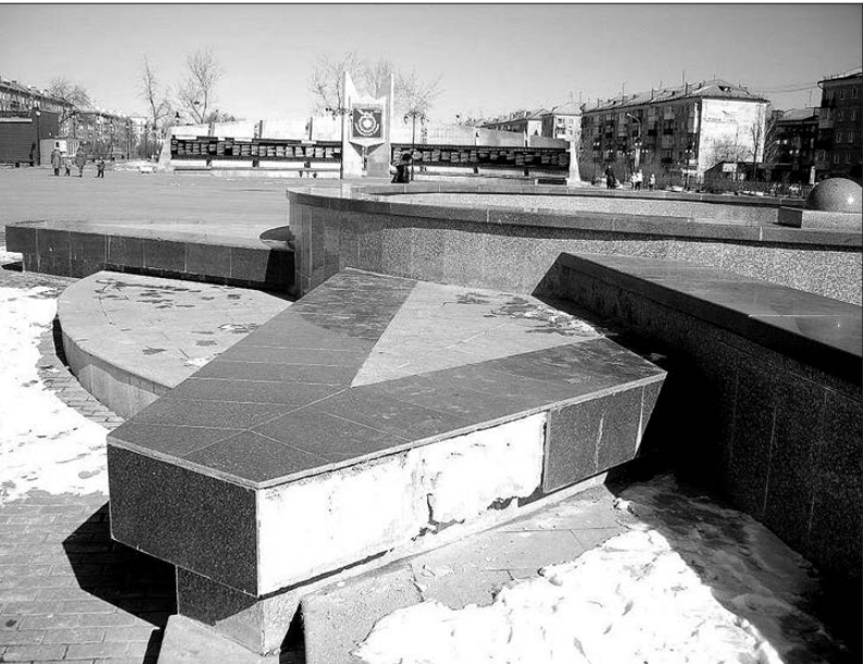
С облицовки фонтана исчезли две плиты.