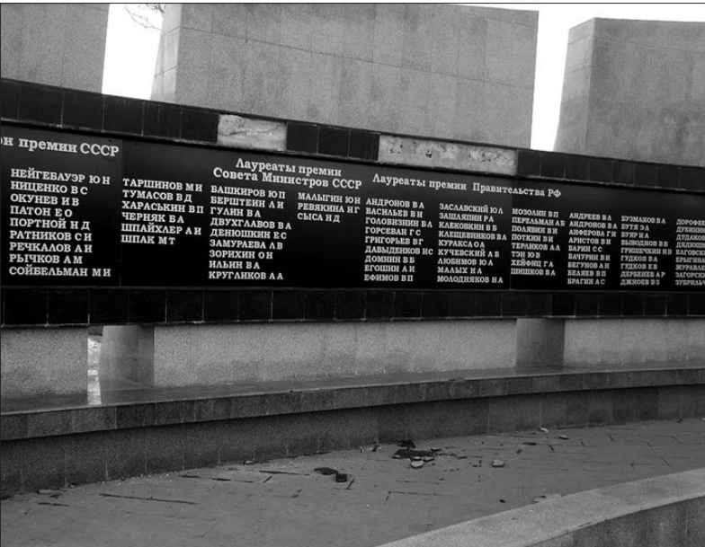
Появились «пропешины» и на Доске почета.

В минувшие выходные, гуляя по территории площади Славы, тагильчане останавливались возле фонтана и Доски почета, что-то рассматривали, а потом доставали из карманов и сумочек мобильные телефоны и фотографировали. Внимание прохожих привлекали отвалившиеся каменные плиты.