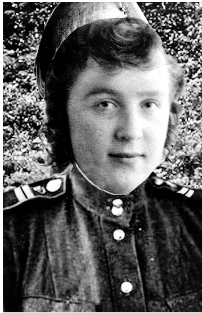
Скоро домой! Апрель 1945 года.