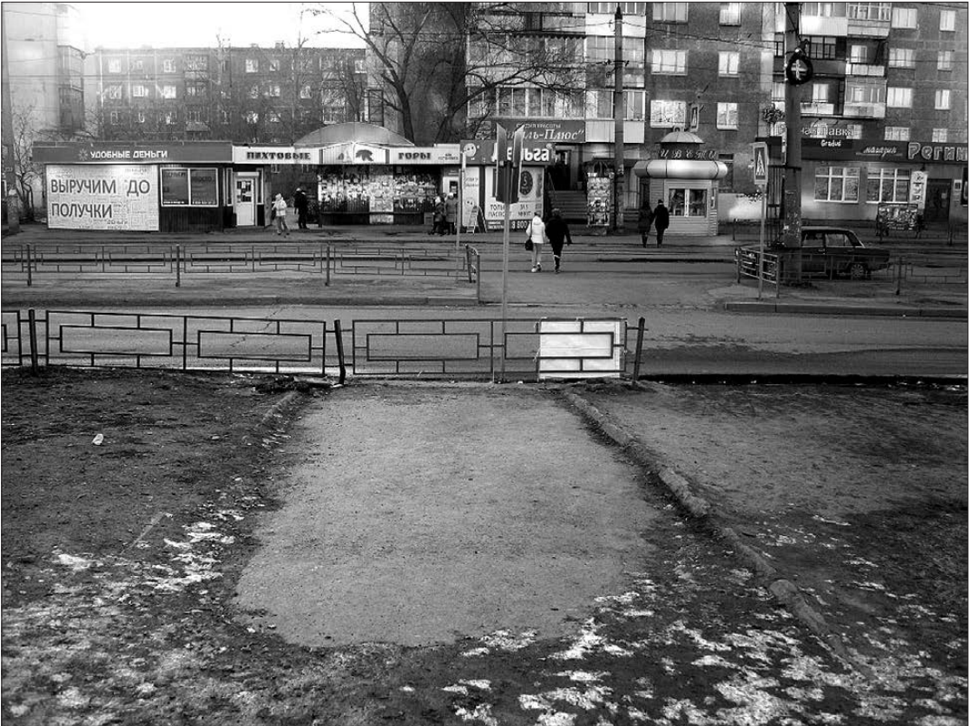
Самый фотографируемый пешеходный переход Вагонки.