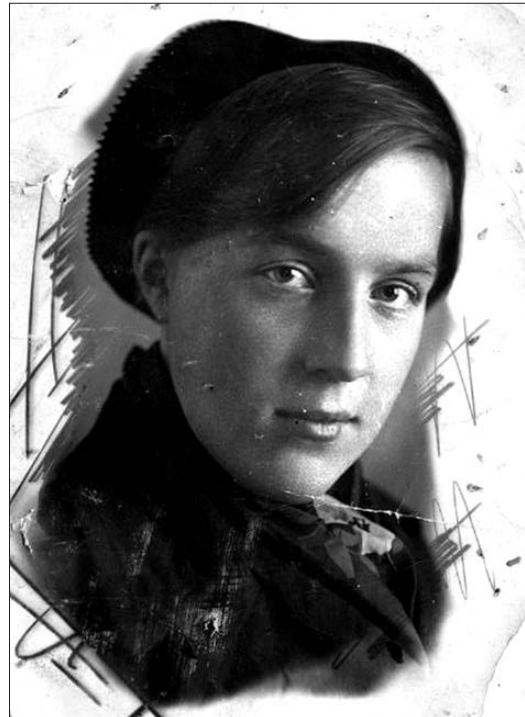
Маме 18 лет. Перед отправкой на фронт.