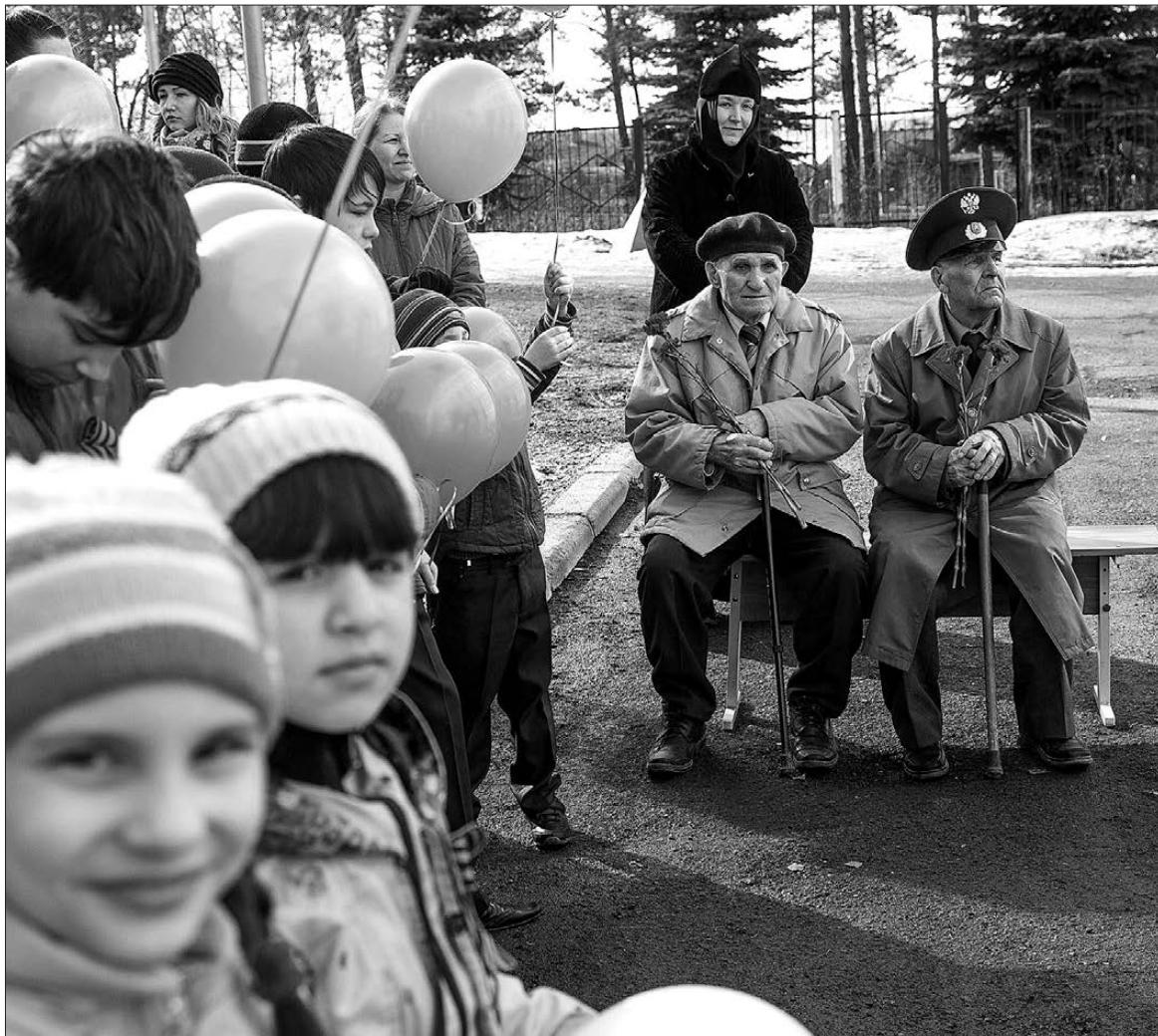
Ветераны вспоминают о былом.