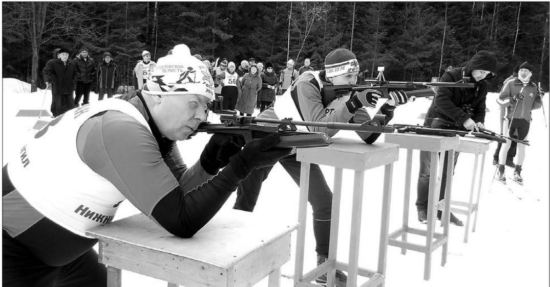
На огневом рубеже.