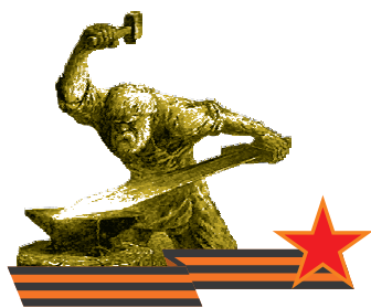
Великой Победе – 70