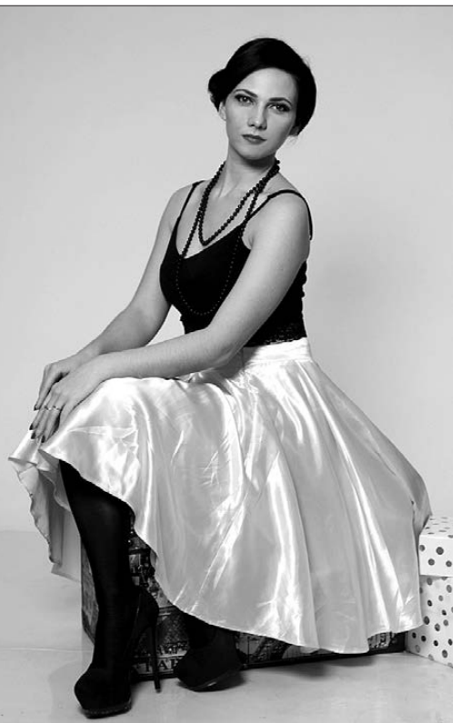
Обычные девушки превратились в красоток в стиле пин-ап.

Давно ли вы были на девичнике? И как он проходил? Примерный сценарий известен всем: собрались подружки за накрытым столом, подвыпили - и началось: у кого что болит, что и где продают, как сбросить лишний вес, «запиши рецепт этого салатика», ну и обязательный рефрен почти всех женских сборищ - «все мужики сво...» Не надоело?