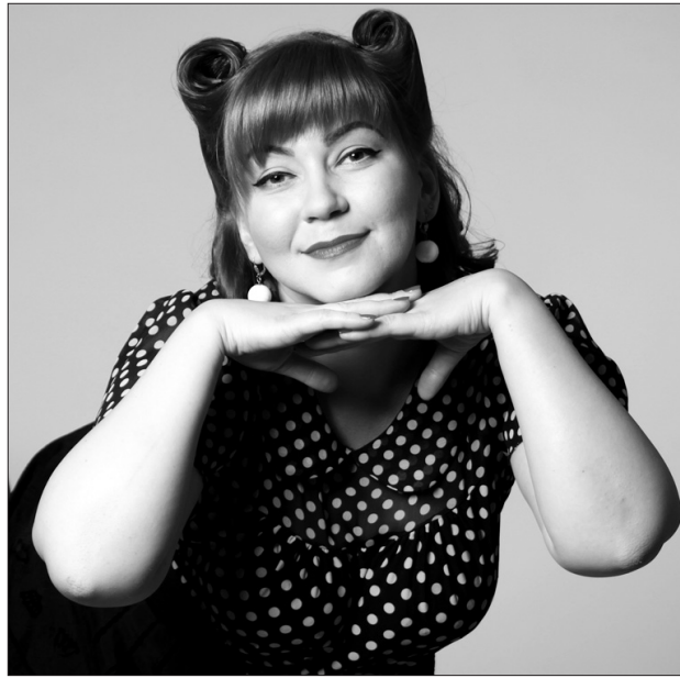
Женственность и кокетство...

Этот слегка кукольный и очень женственный образ зародился в 30-х годах, был на пике популярности в 50-х, а в последующие годы к нему неоднократно возвращались практически все модельеры мира. Почему он вновь стал популярен? Его секрет - в скрытой сексуальности, когда все на грани, все чуть-чуть, как, например, слегка при-