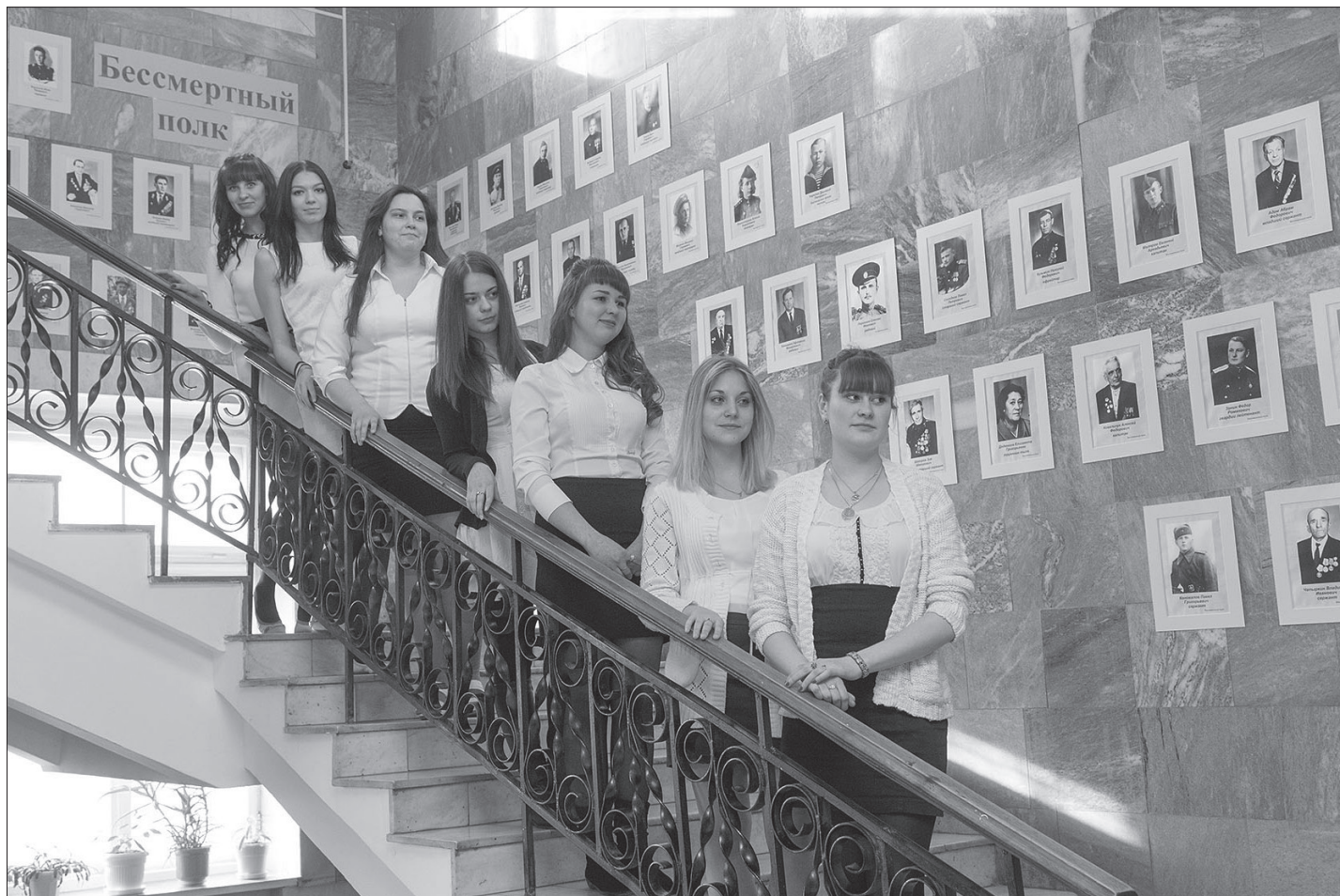
В день открытия выставки первых посетителей встречали портреты «Бессмертного полка» и студенты строительного техникума.