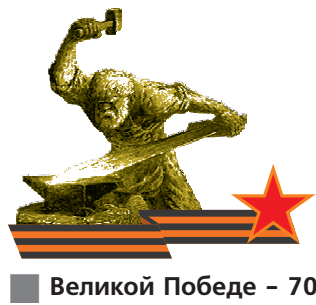
■ Великой Победе - 70