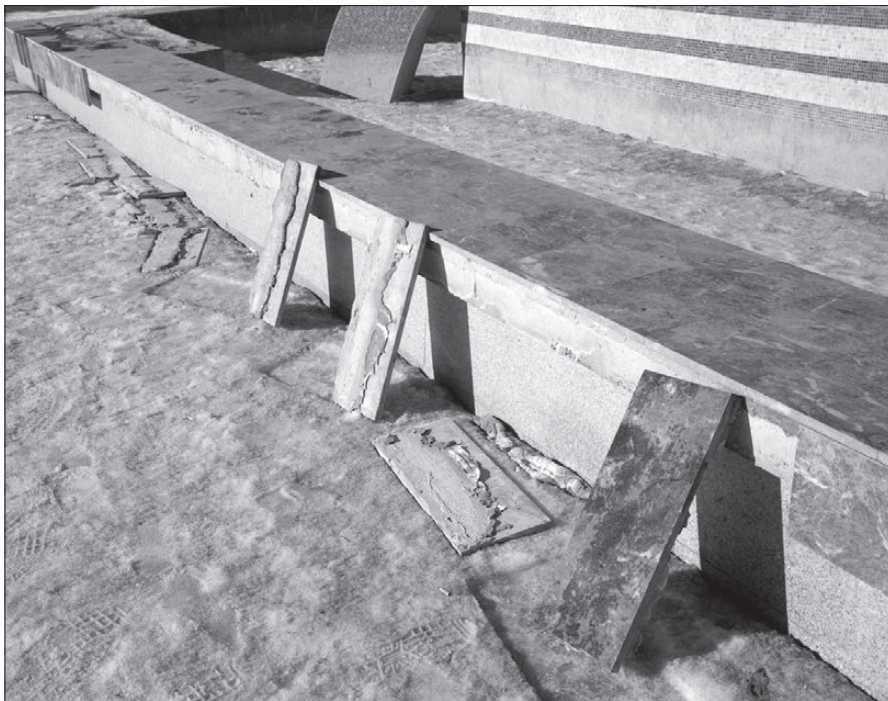
Поврежденный борт фонтана.

Говорят, уральская весна настолько сурова, что снег сходит вместе с асфальтом. Как сообщили неравнодушные читатели «ТР», солнце «растопило» и фонтан «Каменный цветок» на спуске к набережной Тагильского пруда.