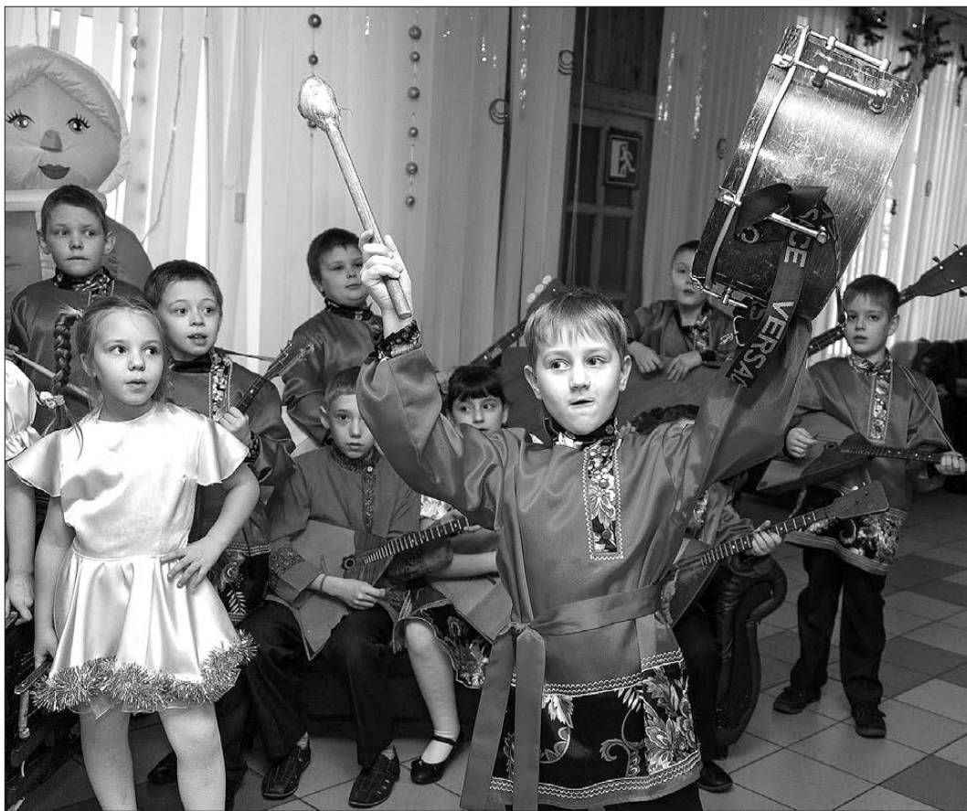
Выступает младшая группа ансамбля.