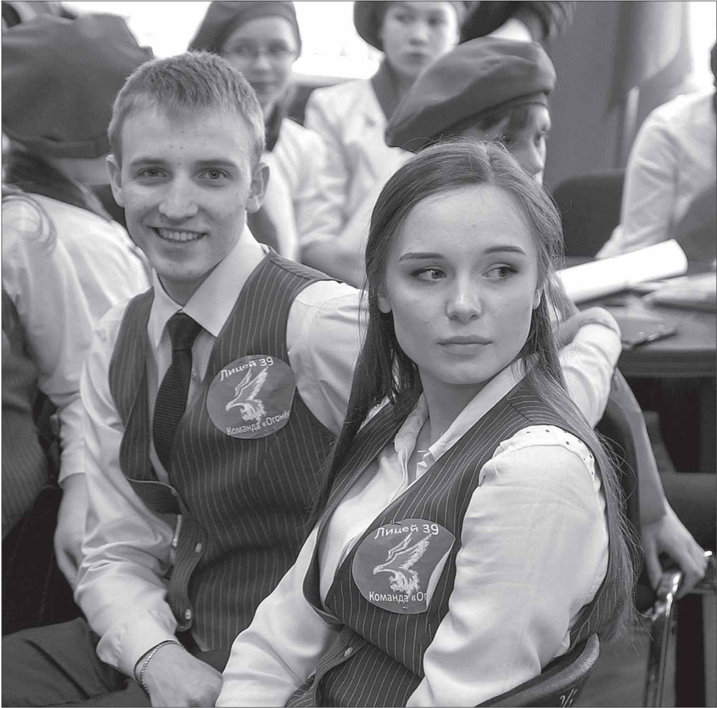
Команда победителей - «Огонек» из лицея №39.