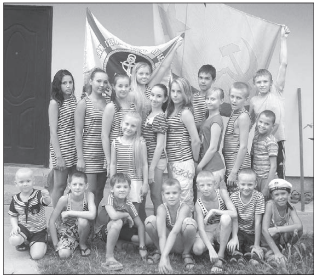
Юные первоуральские тхэквондисты в Севастополе

Лагерь организован союзом ветеранов морской пехоты Свердловской области и нашего города, а также ветеранами севастопольской общественной организации «Чёрные берега». Поэтому пребывание уральских ребят на Украине всегда носит и познавательный характер, военно-патриотическую направленность: встречи с командами кораблей, экскурсии по местам боевой славы – в этот раз впервые побывали на Сапун-горе и посетили диораму защиты города в годы Великой Отечественной войны.