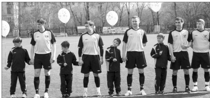
Открытие областного чемпионата в Полевском