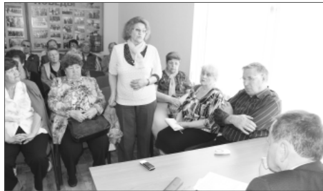
Меся, будучи на пенсии, пригласил начальника цеха складов работать на приёмке оборудования для ЭСПК. Это такие деньги, такое количество оборудо-

Бывший начальник цеха № 12 напомнил присутствующим, как портили воздух травильные отделения, как цех № 7 ждал строительства газоочистки несколько лет, как шумно было в цехах. «Не надо создавать шумиху вокруг рабочего процесса», - сказал ветеран.