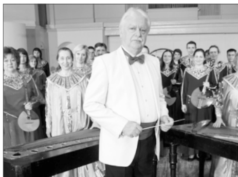
Главный дирижер, Народный артист России Владимир Андропов

В завершении выступления поинтересовалась у концертмей-