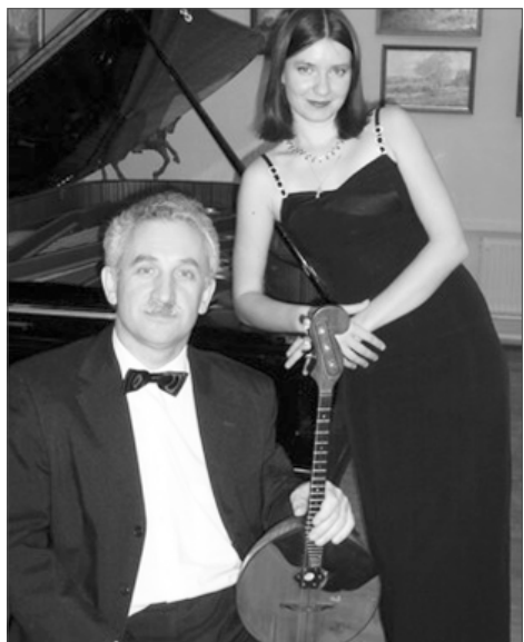
Концертмейстер, Народный артист России, профессор Сергей Лукин