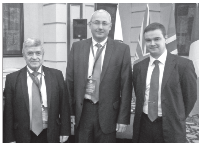
Члены российской делегации

Группа ЧТПЗ четвертый год успешно реализует совместно с Министерством образования Свердловской области и Первоуральским металлургическим колледжем образовательную программу «Будущее белой металлургии». Образовательный центр создаёт благоприятные условия для формирования карьеры инженера - обучение ведётся по дуальной системе,