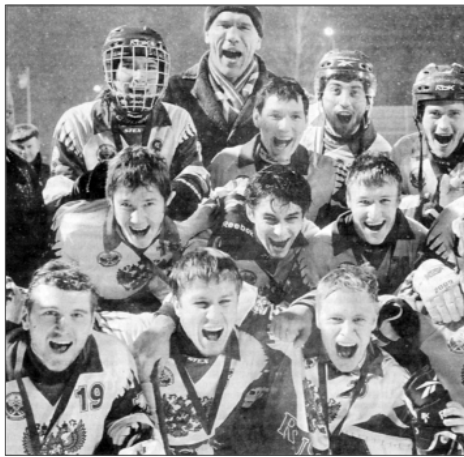
Молодёжь России – чемпион мира!