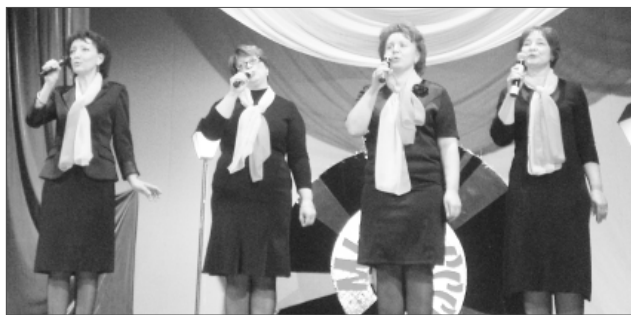
Ансамбль городской больницы № 8

Конферанسه говорили исключительно лозунгами, передавая атмосферу советской эпохи. Например, «Да здравствует советская народная интеллигенция!». Именно её представители и сегодня в авангарде. Врачи, учителя, деятели культуры разнопланово представили своё творчество. Вообще, во время программы жюри и зрители приятно удивлялись, что в нашем городе столько талантли-