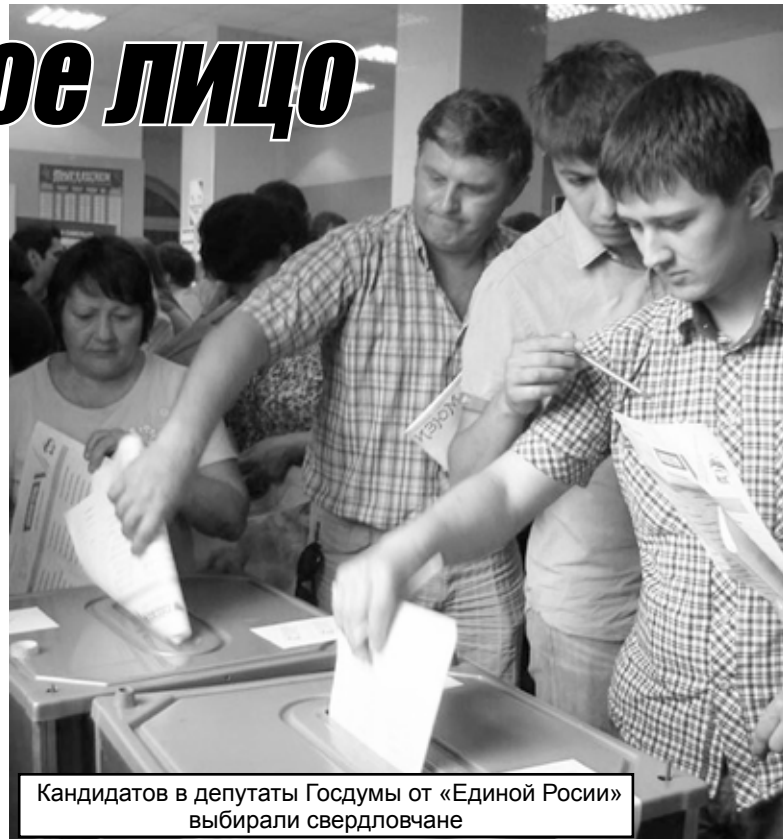
Кандидатов в депутаты Госдумы от «Единой России» выбирали свердловчане