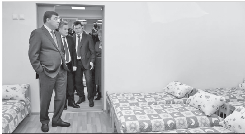
В спальне реконструированного детсада