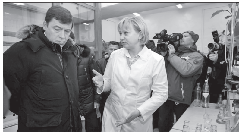
На фильтровальной станции