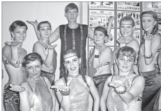
Сборная команда Новотрубного

Обычно в любительских танцевальных коллективах существует проблема с мужчинами. Поэтому дебют мужской команды с «Динура» для многих был неожиданностью. Оказалось, работники предприятия не только отлично трудятся на производстве, но и любят танцевать. Сложные движения выполняли с лёгкостью, попадая в ритм, в ре-