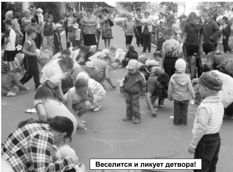
Веселится и ликует детвора!