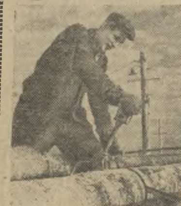
Омская область. Коллектив Екатеринбургского лесопункта

У нас слишком мала посевная площадь. Мы просим ее увеличить до 1000 гектаров.