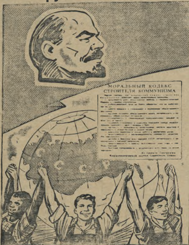
Рисунок В. Жаринова.

«ПРАВДА КОММУНИЗМА» 2 стр. 1 октября 1961 года