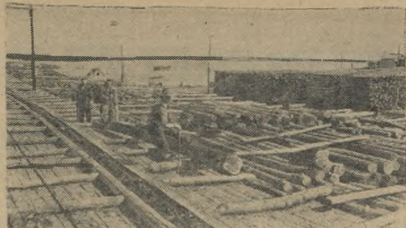
Коми АССР. По крупным рекам и более чем по 250 мелким производится сплав леса в Коми АССР.

Самая большая в республике Печорская лесоперевалочная база треста «Печорлесосплав» — хорошо оснащенное и механизированное предприятие. Сюда в плотах сплавляется лес с верховьев Печоры. На сплавном участке производится его размолька и древесина попадает в рабочую запань, откуда извлекается лесотасками, штабелем и отгружается по железной дороге.