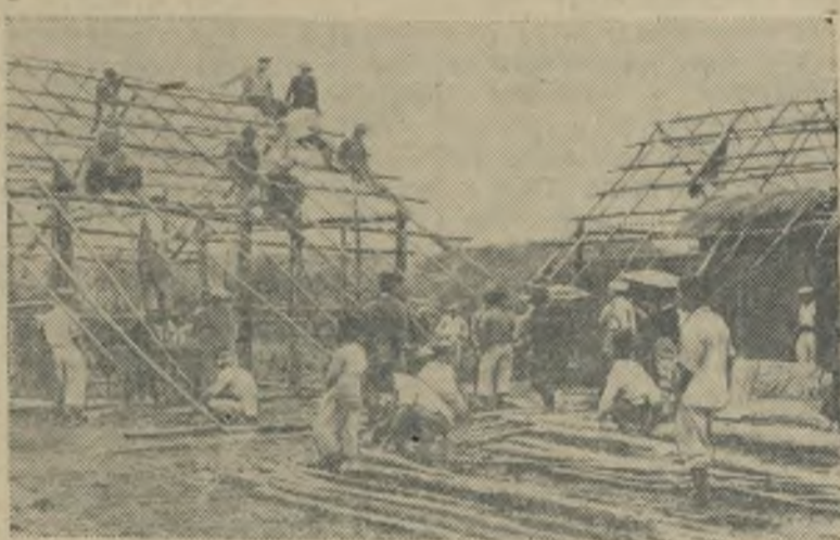
Лаос. Строительство начальной школы в провинции Сиенг-Куанг.

потребления в августе этого года возрос на 5,5 процента по сравнению с соответствующим периодом прошлого года. Особенно возросли цены на продукты питания.