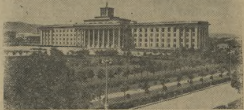
Нальчик. Дом Советов на проспекте имени Ленина.

Так же торжественно проводили в школу малышей и из детского сада, где ведущая тов. Осколкова. В. ПАРАМОНОВ.